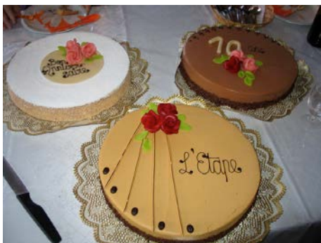
Les 10 ans : le 6 juin 2008