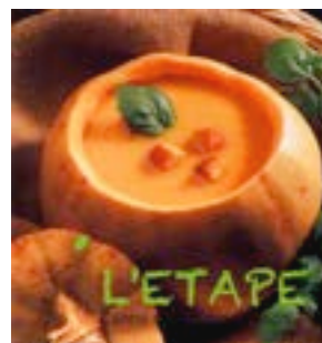
LA SOUPE DE LA ST- MARTIN CHAQUE ANNÉE