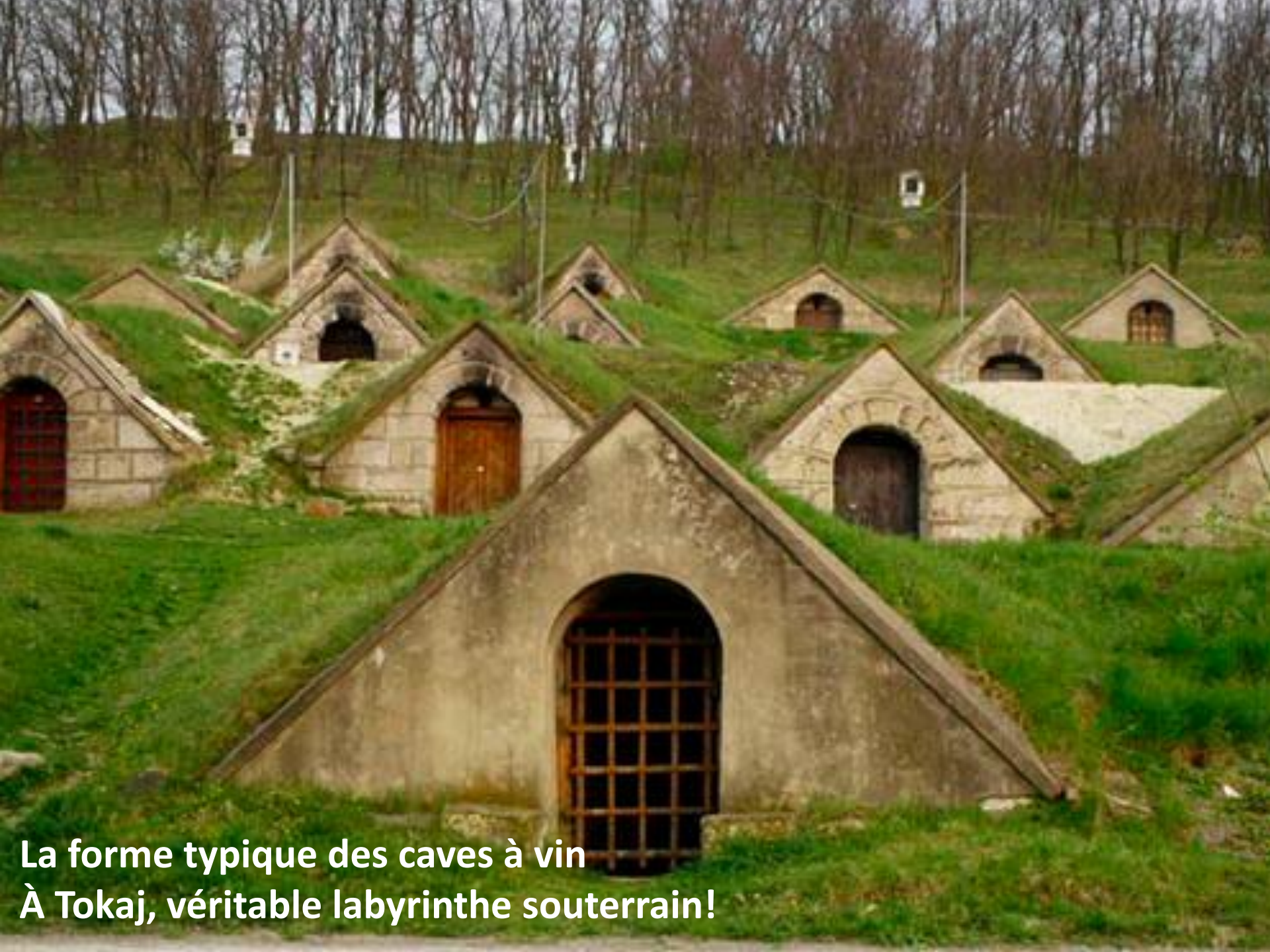
La forme typique des caves à vin À Tokaj, véritable labyrinthe souterrain!